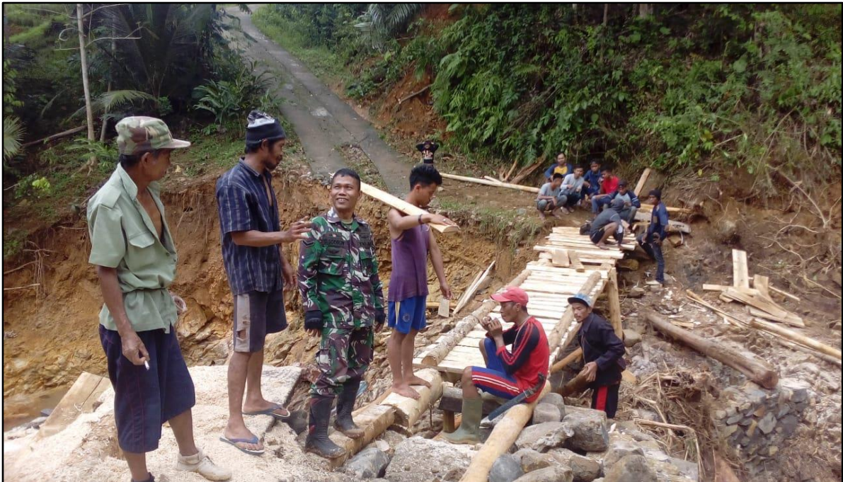
PELAKSANAAN KEGIATAN PENANGGULANGAN BENCANA