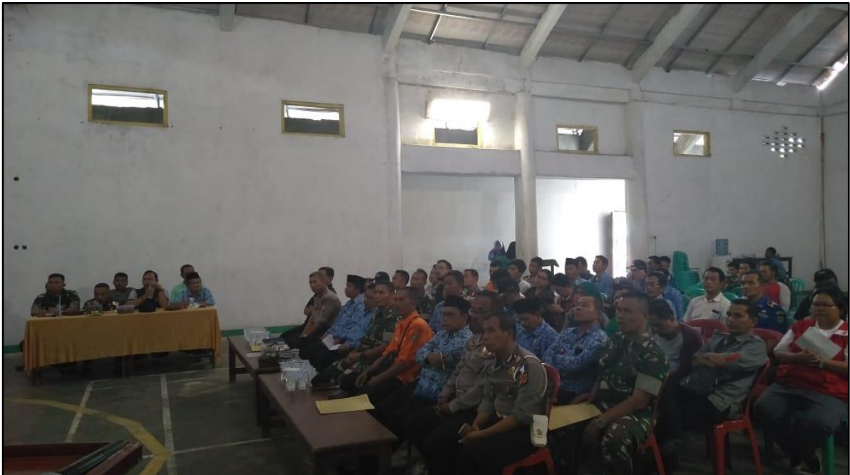
RAPAT KOORDINASI PENANGULANGAN BENCANA