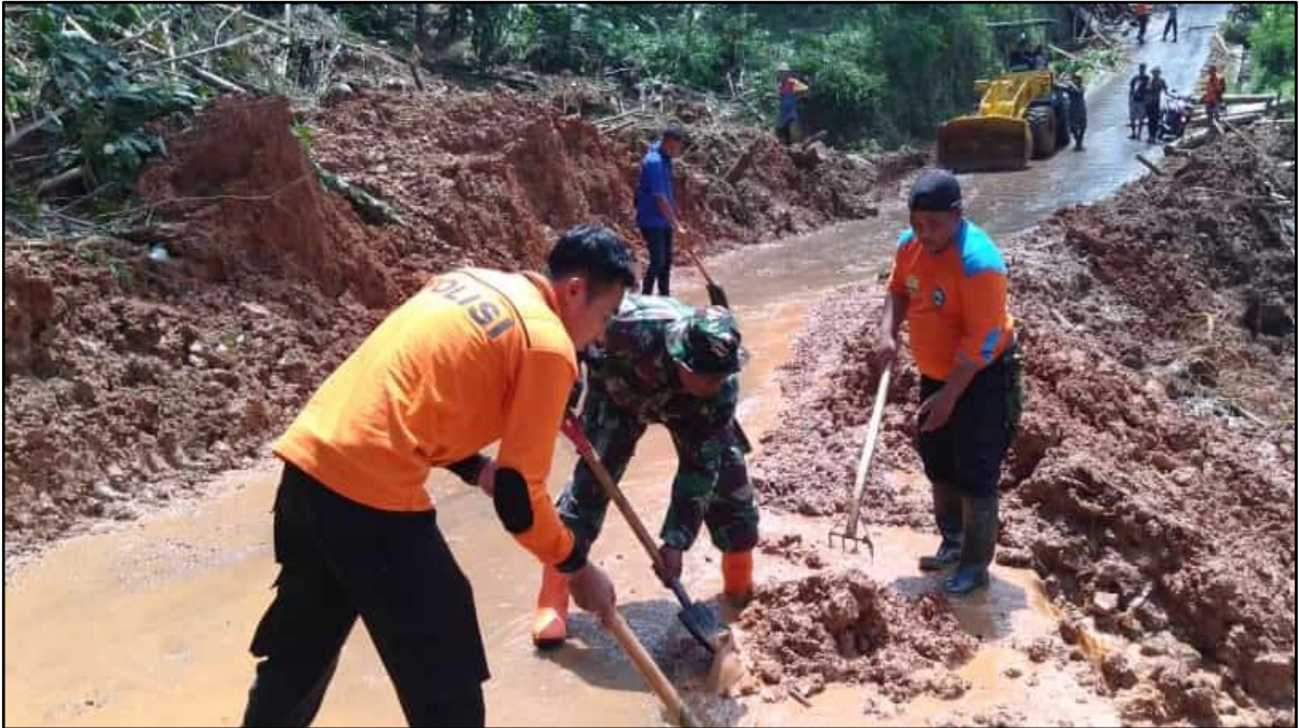
PELAKSANAAN KEGIATAN PENANGGULANGAN BENCANA