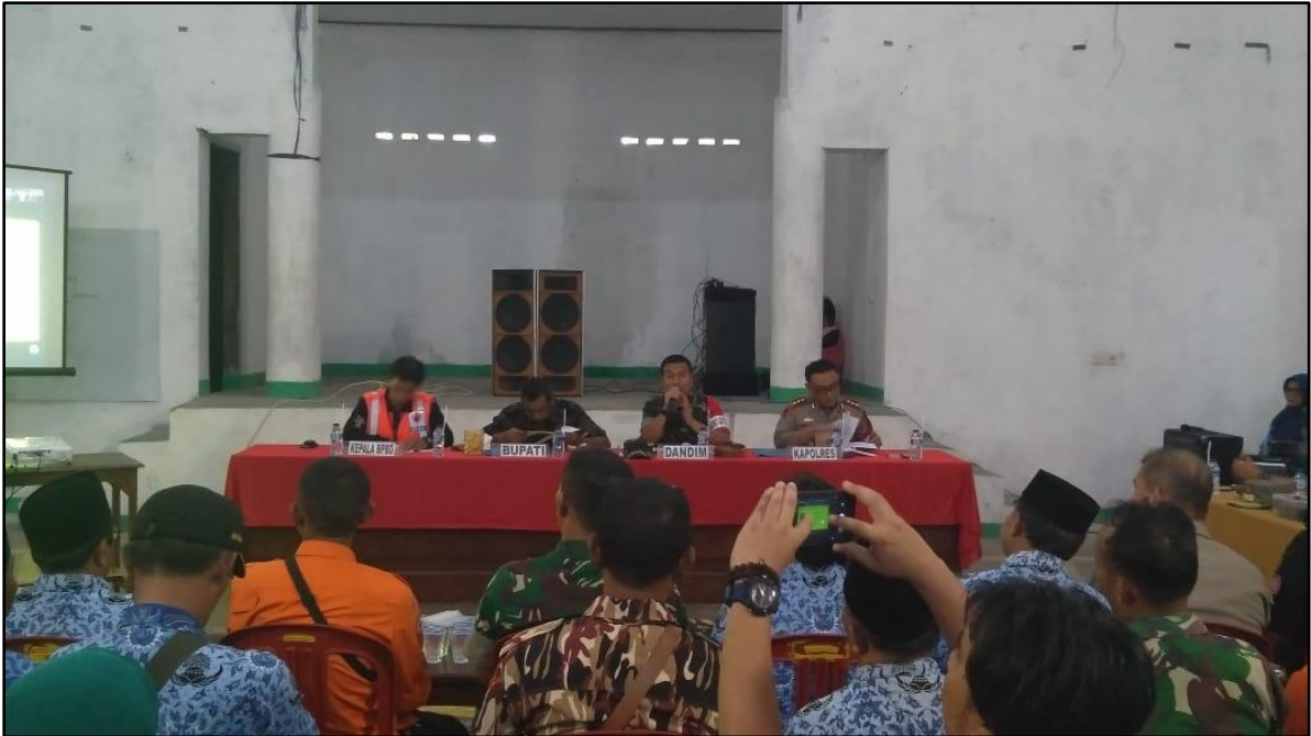
RAPAT KOORDINASI PENANGULANGAN BENCANA