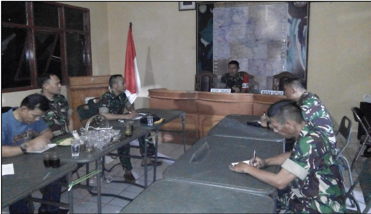
EVALUASI KEGIATAN PENANGGULANGAN BENCANA

Komandan Kodim 0612/Tasikmlaya Selaku Incident Commander,